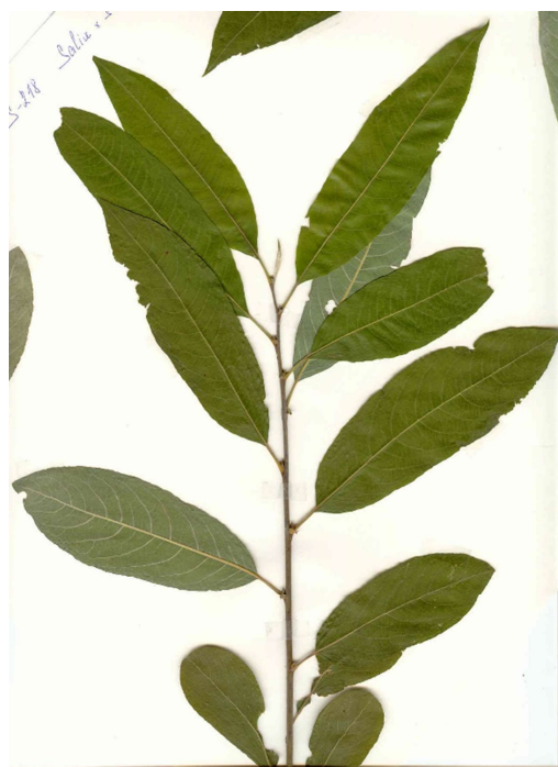
Zpracoval: Jan Weger

Tvoří mnohokmenné keře, při pěstování ve volnějším sponu poměrně rozkladité. Má nápadné velké široce kopinaté listy, svrchu lesklé a bohatě chlupaté na vnitřní straně. Žilky odstupují ve značném počtu pod pravým úhlem od hlavního nervu. Kolem pupenových jizev se na zimním kmeni a větvích se často vyskytují 2 typické šupiny „růžky“. Kvete časně (samice, III-IV), před rašením listů.